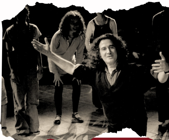
Ilustración 2. Augusto Boal

Décadas después, durante el período comprendido entre 1971 y 1986, el dramaturgo, escritor y director Augusto Boal (Río de Janeiro, 1931-2009) desde la compañía de Teatro Arena en Brasil dirigió numerosas escenificaciones de autores brasileños y extranjeros para conseguir un lenguaje teatral comprometido con la realidad social que se vivía, convirtiéndose en un auténtico referente de la sociedad brasileña.