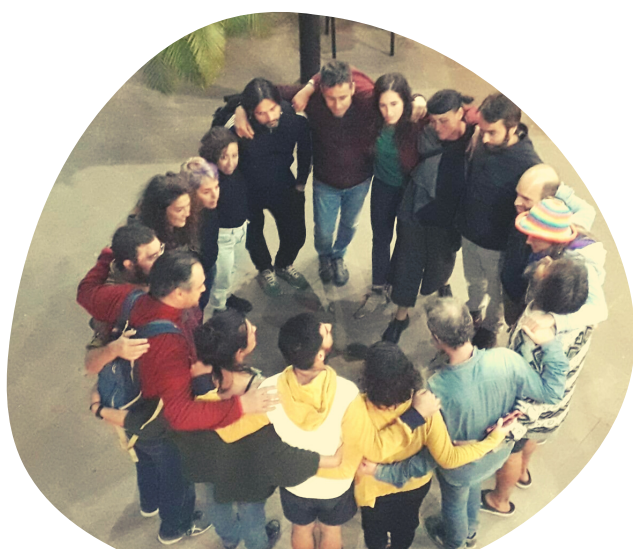
Ilustración 9. Teatro Foro en CCultural Agaete

Dependiendo del tiempo que se disponga para la realización de la obra y del propio ritmo del grupo, se vuelve a incitar a pensar en nuevas y alternativas propuestas dejando volar la imaginación en pro de probar todas las soluciones posibles.