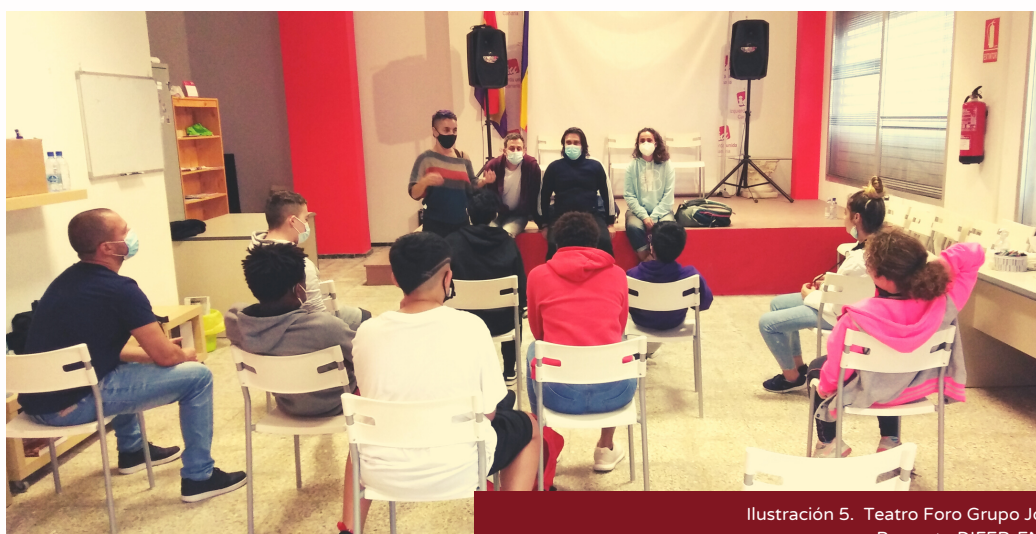
Ilustración 5. Teatro Foro Grupo Jóvenes. Proyecto DIFER-EN-TISS Fuente: Compañía de Teatro social Rebumbio. ;

Una vez representadas en escena, estas situaciones de desigualdad, discriminación e injusticia va a dar lugar a un dialogo activo con el público. En el foro, tras el debate se invita el público a subir a escena para buscar y ensayar colectivamente alternativas a los problemas planteados. El teatro es aquí un ensayo para el cambio de la realidad cotidiana.