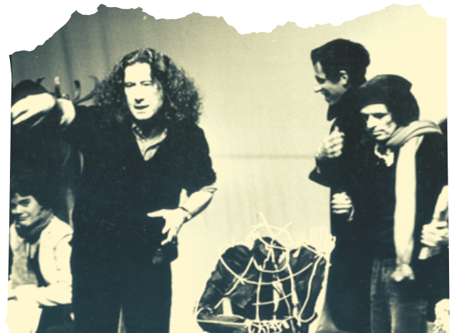
Ilustración 3. Boal con alumnos del “Centre du Théâtre de l’Opprimé”, París, 1979.

A partir de 1974 se publican distintos libros que reflejaban todas las experiencias acumuladas para conseguir que la persona espectadora se liberara de su condición pasiva en cuanto a receptora de un espectáculo, y fuera parte activa, surgiendo el concepto de espect-actor (Beltrán, 2002). Como dice Boal (2009) “el espectador ya no delega poderes en los personajes ni para que piensen ni para que actúen en su lugar. El espectador se libera: ¡piensa y actúa por sí mismo!” (p. 64).