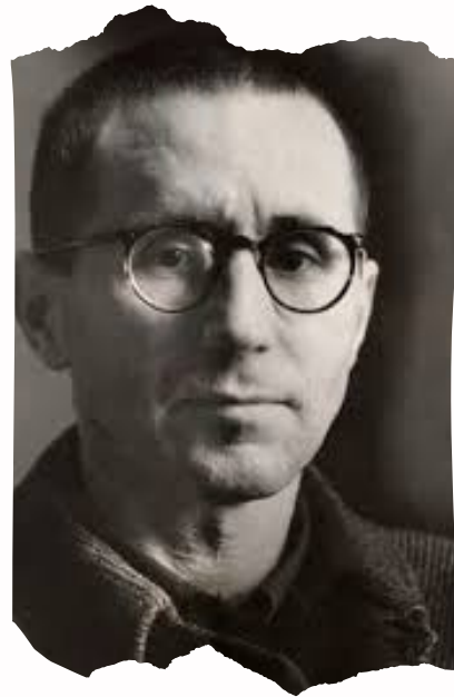
Ilustración 1. Bertolt Brecht

En el siglo XX (1910 y 1950 aproximadamente) se manifiesta Bertolt Brecht, uno de los dramaturgos más destacados e innovadores, que cuestiona al teatro que entretiene y adormece sin hacer reflexionar sobre lo que sucede en lo cotidiano. Fundó el teatro del distanciamiento donde no solo trataba de afectar emociones y sentimientos sino de convocar una conciencia crítica, una reflexión. A través de la obra teatral buscaba la toma de conciencia y reflexión de las personas espectadoras, tratando de fomentar el activismo social y político.