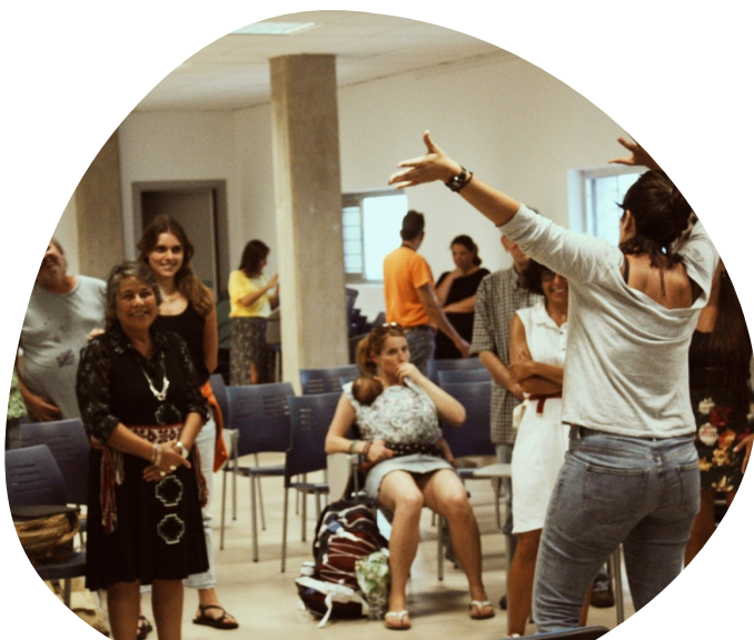
Ilustración 6. Teatro Foro en Suarez Naranjo Fuente: Compañía de Teatro Social Rebumbio;