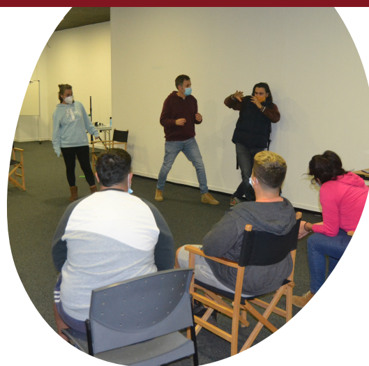
Ilustración 10. Teatro Foro en Espacio Digital

En el TF todos y todas tienen la posibilidad de dialogar y actuar propuestas de transformación, buscando con ello que la comunidad reunida sea sujeto activo del cambio de sus realidades, apoyada en el espacio teatral. Es así como en el TF se espera que el público se convierta en 'espectador/actriz', entrando en escena para actuar su propia idea frente a la pregunta: