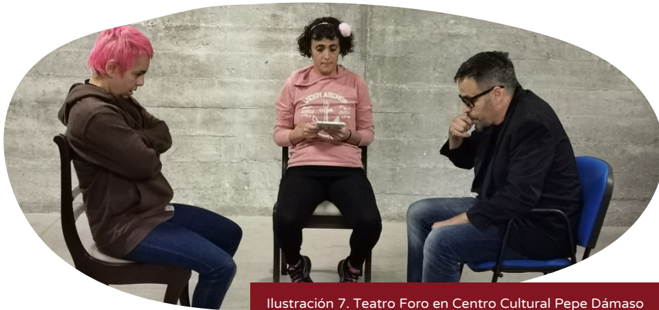
Ilustración 7. Teatro Foro en Centro Cultural Pepe Dámaso