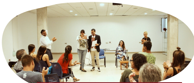
Ilustración 8. Teatro Foro en Suarez Naranjo .

Una vez finalizado la propuesta de cambio la facilitadora pregunta a la persona participante cómo le fue, cómo se sintió y si pudo realizar la propuesta que había pensado, después de que se haya expresado, se agradece su participación con un gran aplauso y se vuelve abrir el foro, comentando lo acontecido valorando qué ha mejorado en la situación, y comentando las modificaciones.