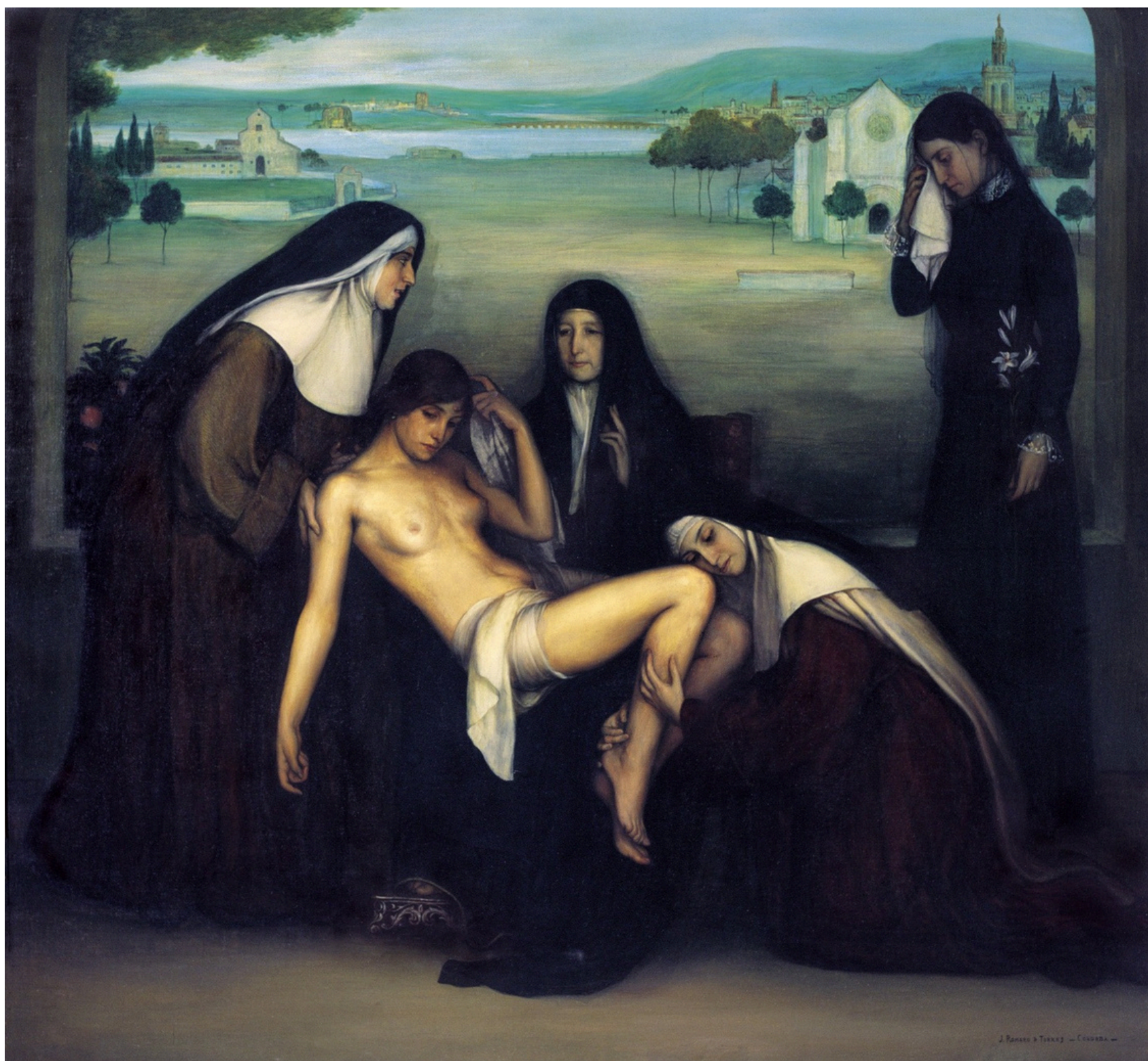
La gracia , 1913. Museo Julio Romero de Torres, Córdoba