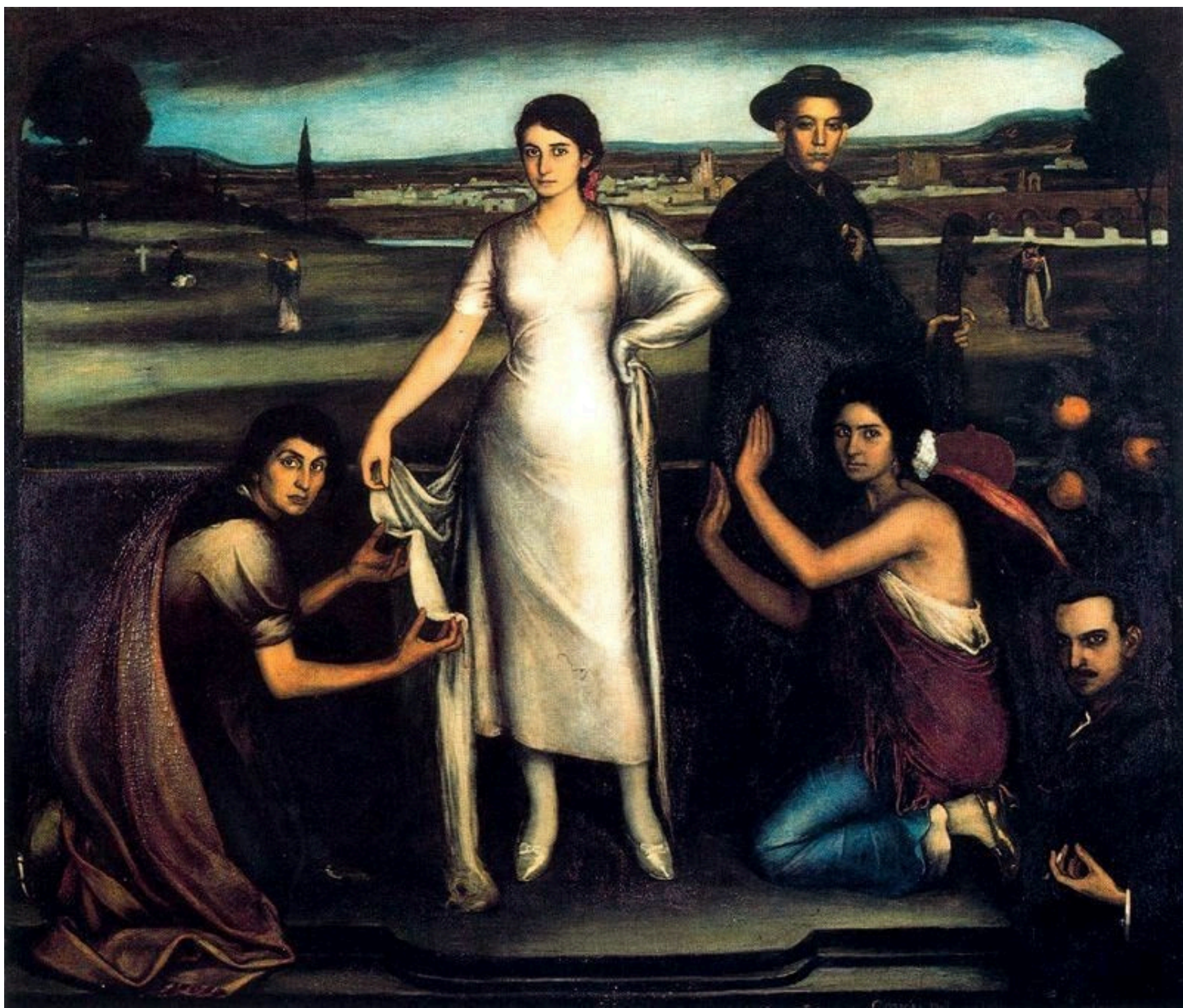
Nuestra Señora de Andalucía, 1907. Museo Julio Romero de Torres, Córdoba