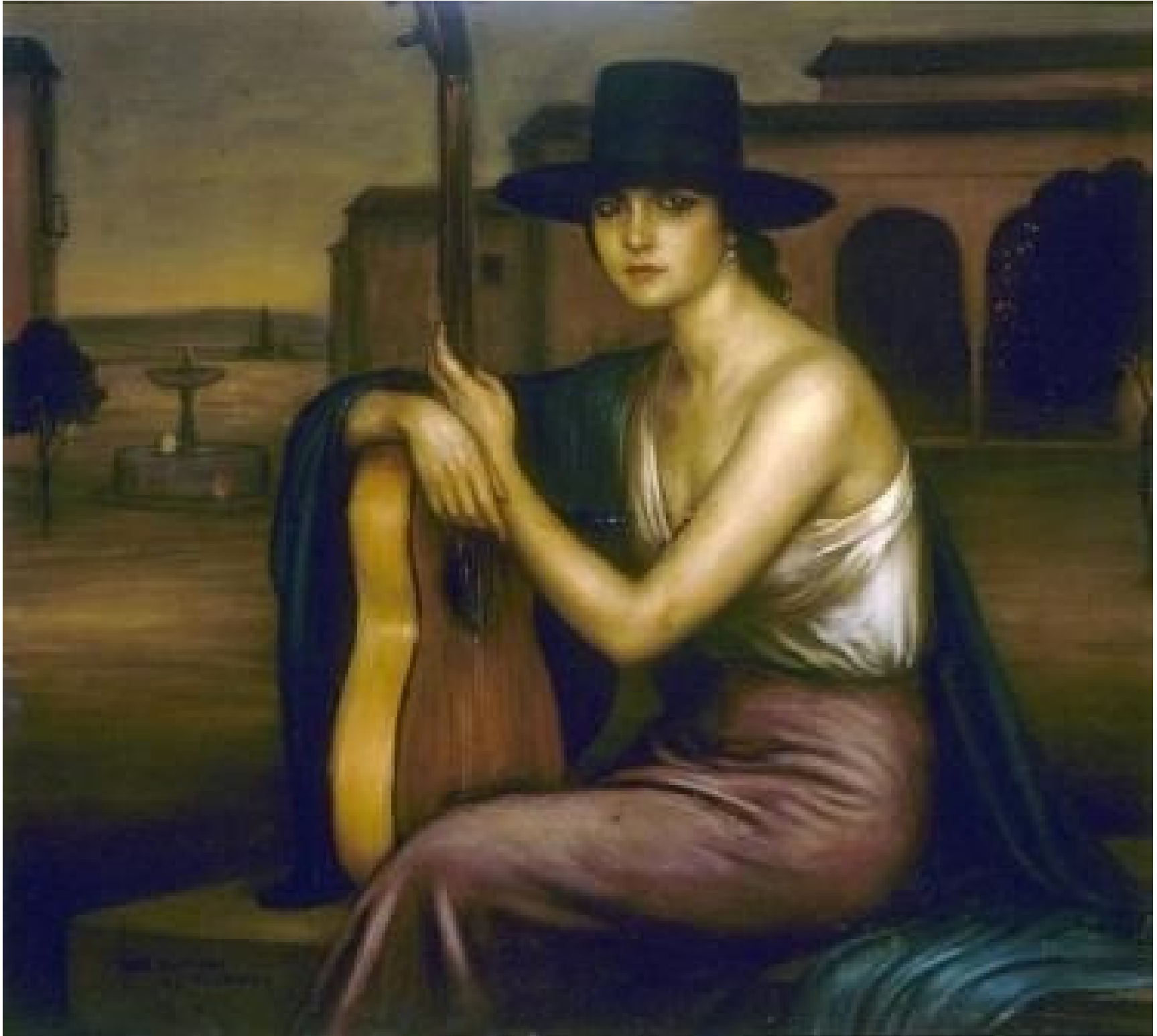
Cordobesa con guitarra, 1926. Colección privada.