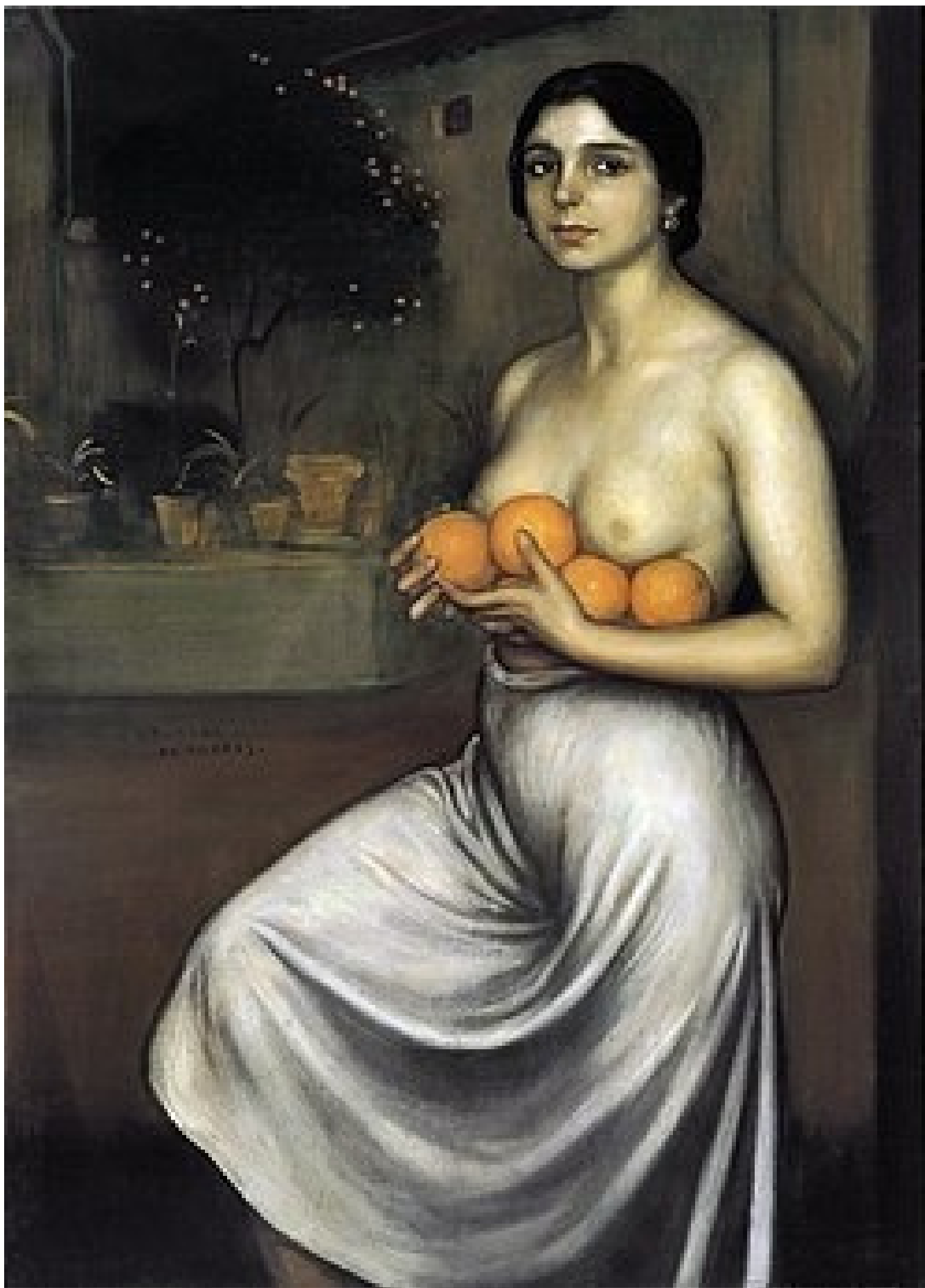
Naranjas y limones, 1928. Museo Julio Romero de Torres, Córdoba