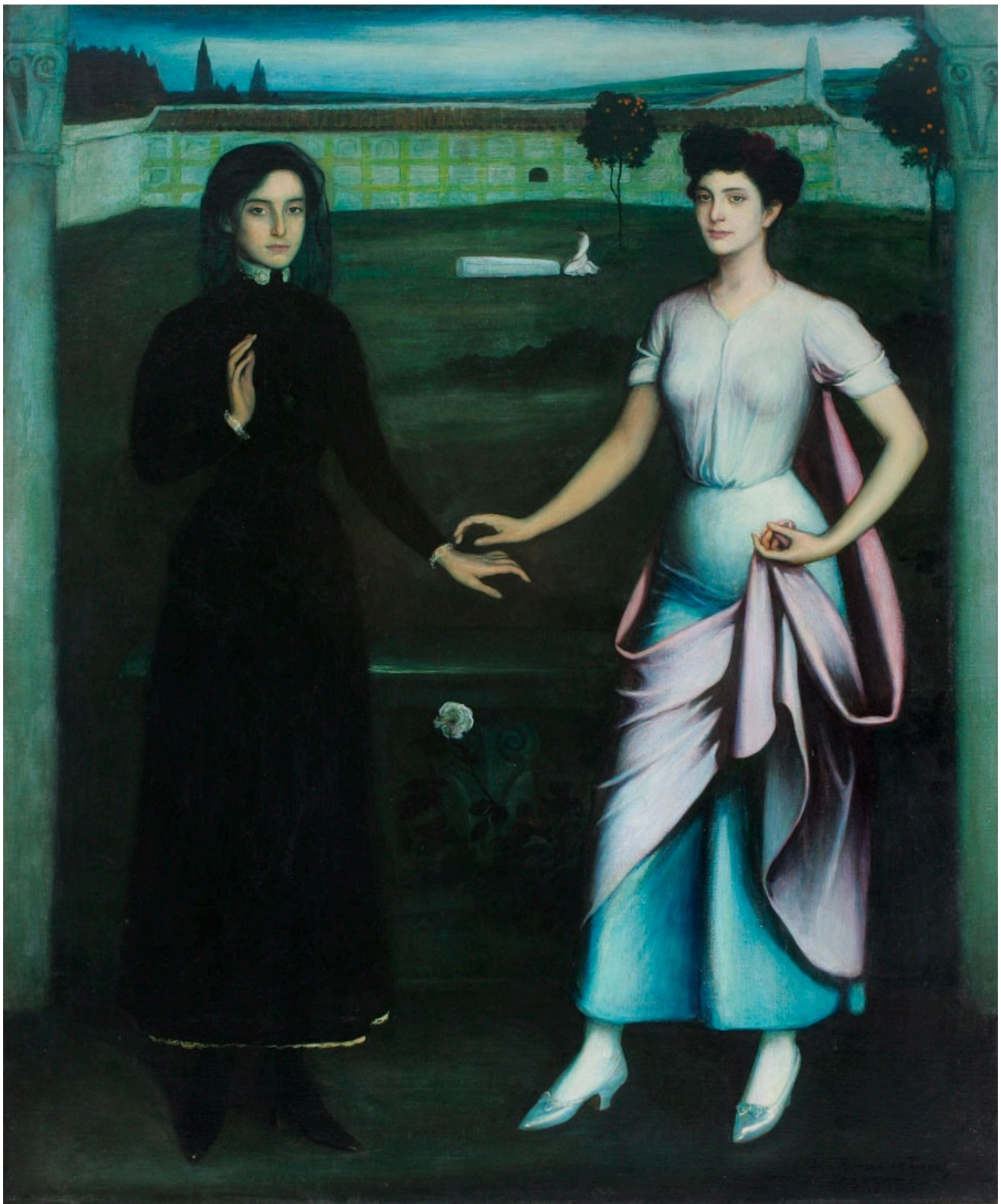
Amor místico y amor profano, 1908. Palacio de Viana, Fundación Cajasur, Córdoba