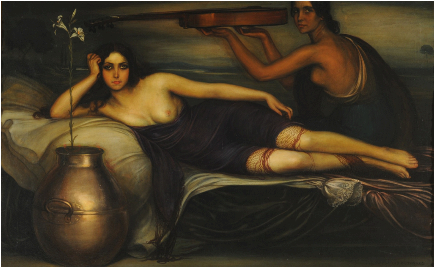
Musidora , 1922. Museo Nacional de Bellas Artes, Buenos Aires (Argentina)