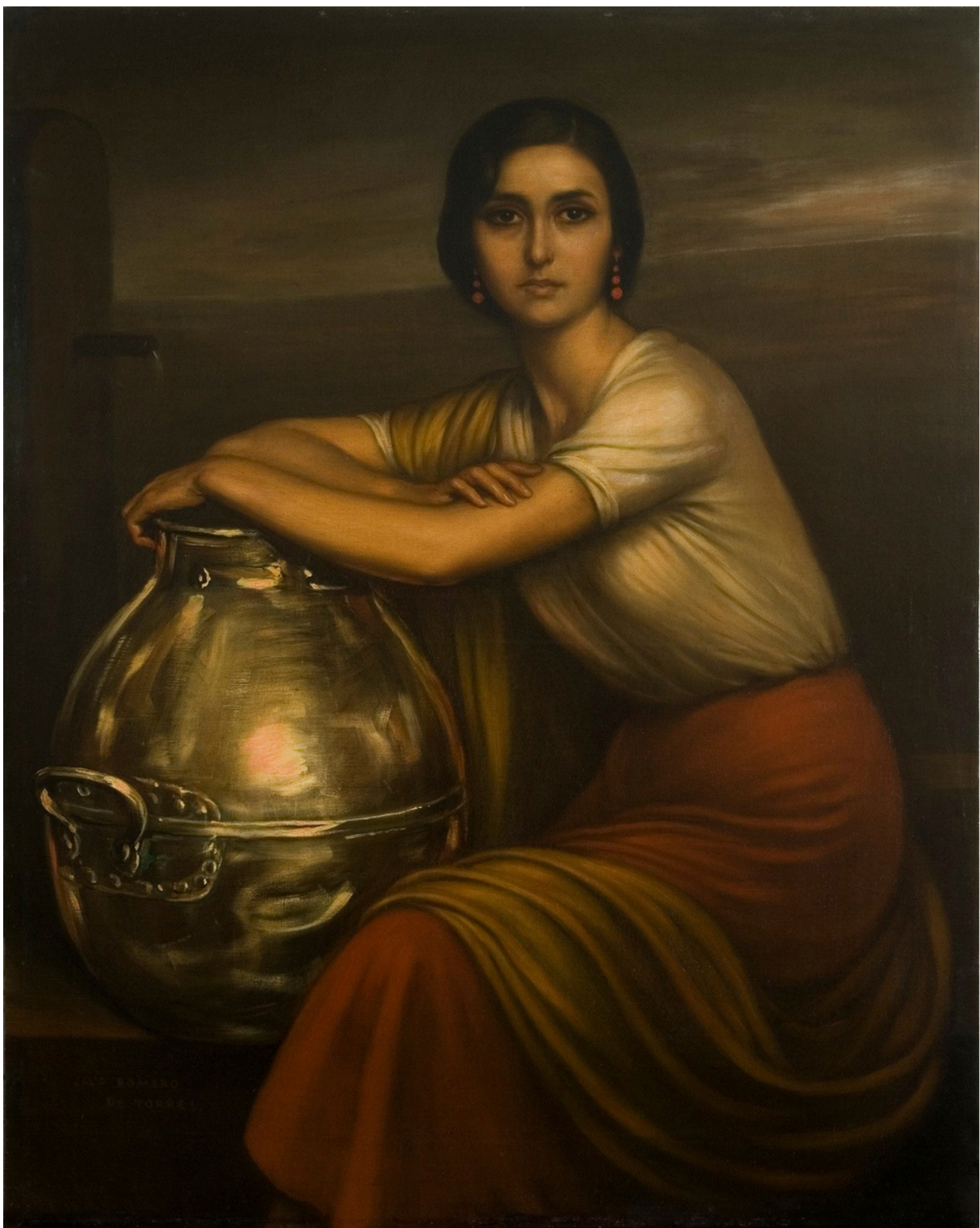
Fuensanta, 1929. Colección privada, Madrid