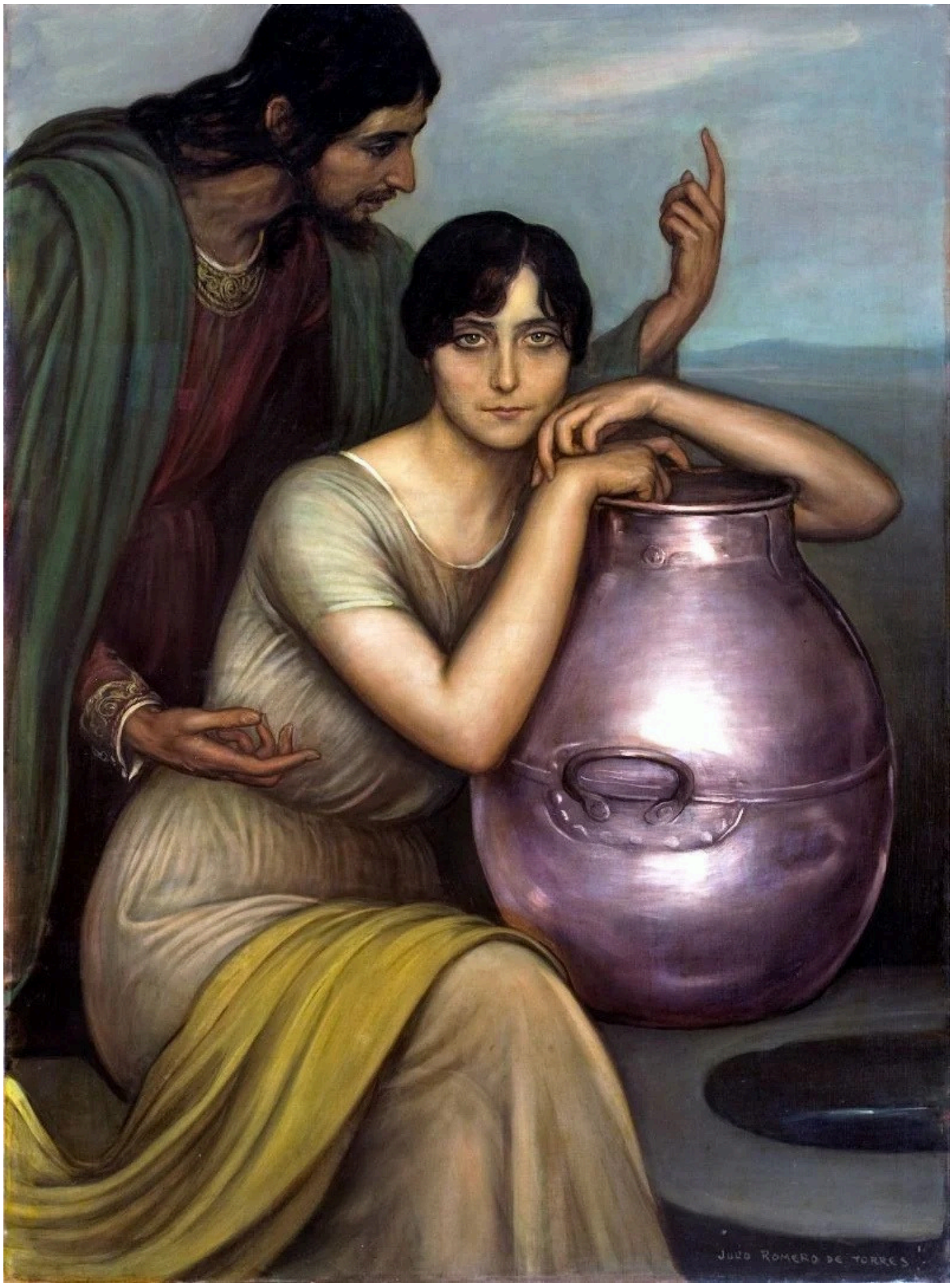
Samaritana , 1920. Museo Julio Romero de Torres, Córdoba