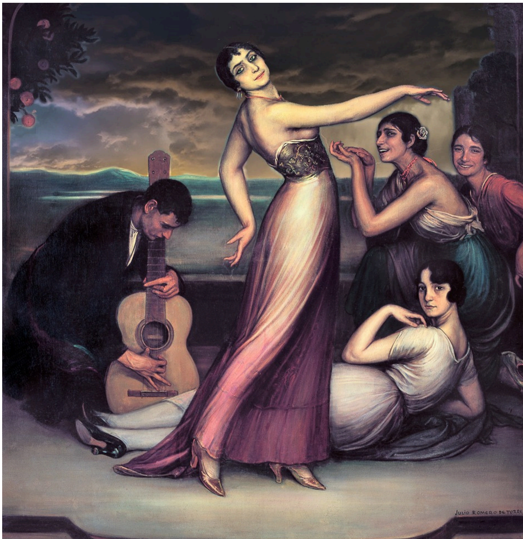
Alegrías, 1917. Museo Julio Romero de Torres, Córdoba