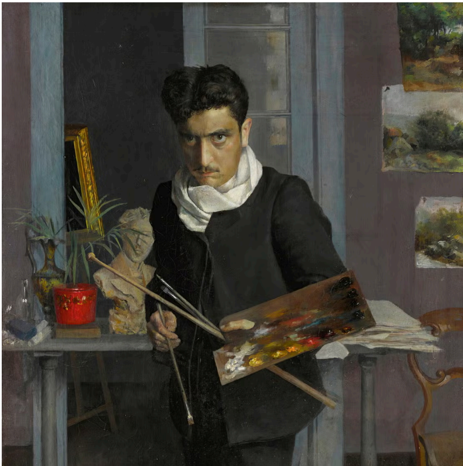
JULIO ROMERO TORRES, CÓRDOBA, 1874-1930