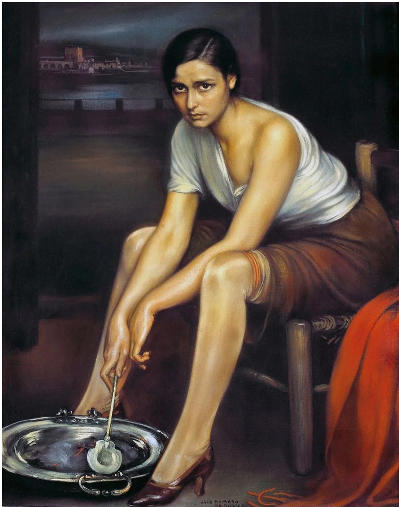
Chiquita piconera , 1930. Museo Julio Romero de Torres, Córdoba