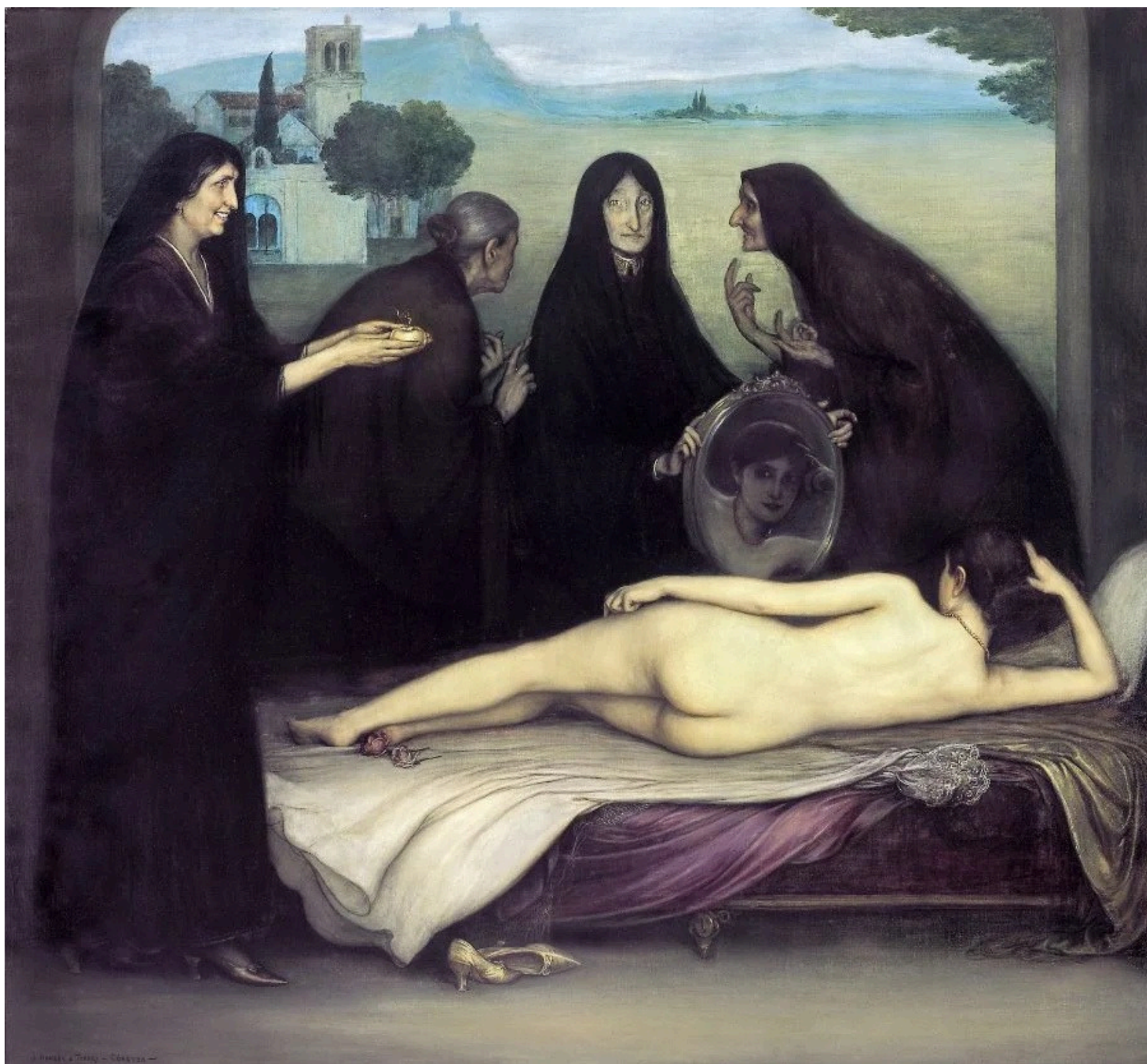
El pecado, 1913. Museo Julio Romero de Torres, Córdoba.