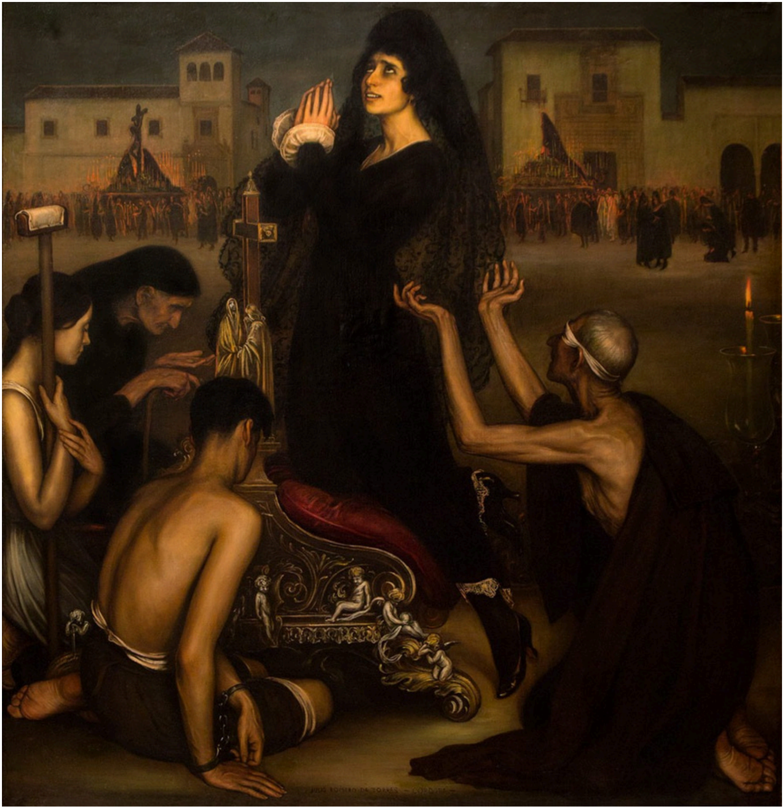
La saeta , 1917. Palacio de Viana, Fundación Cajasur, Córdoba.