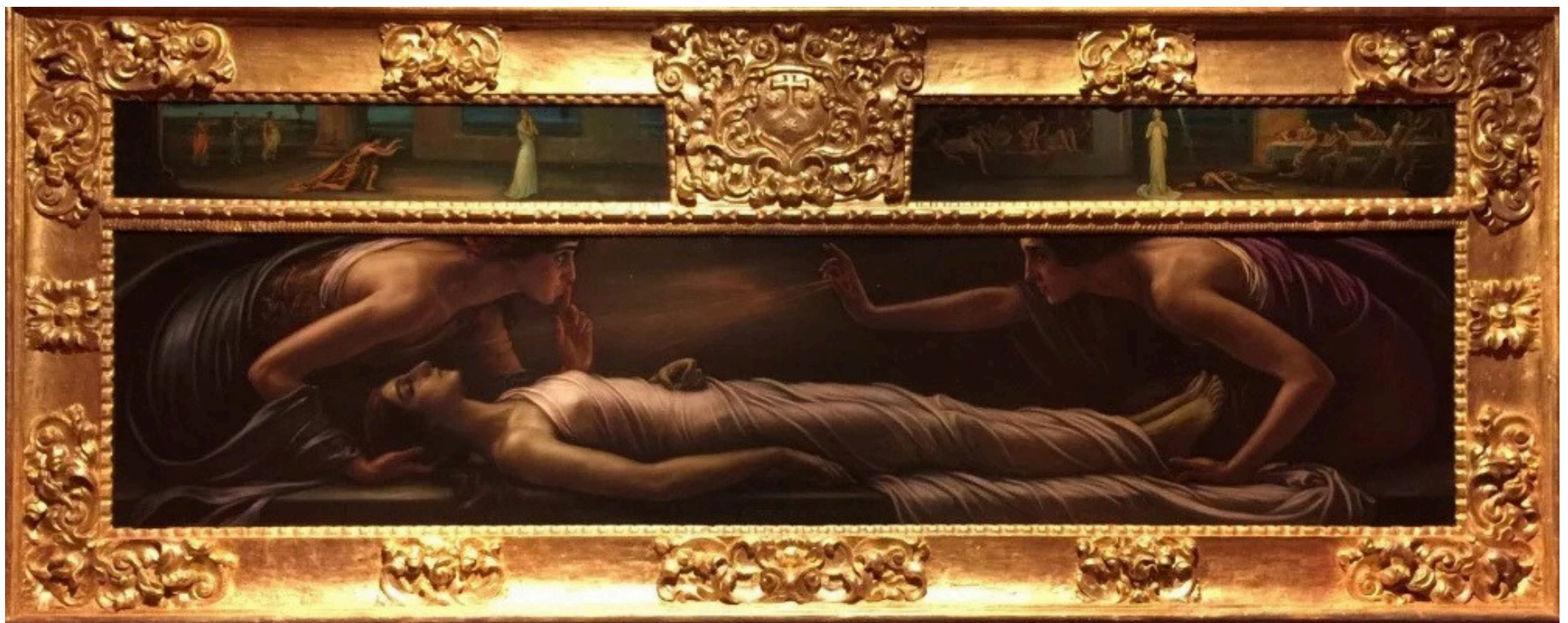
La muerte de Santa Inés, 1920. Museo Julio Romero de Torres, Córdoba