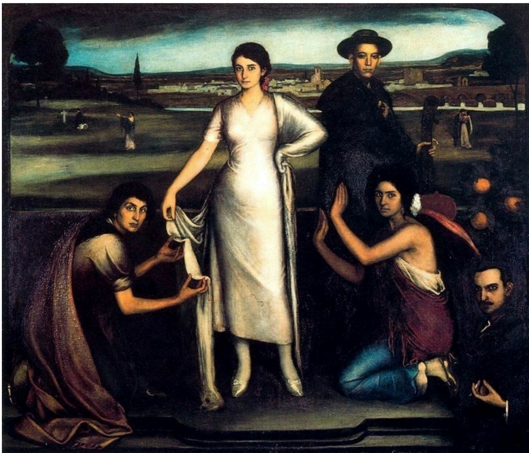
Nuestra Señora de Andalucía, 1907. Museo Julio Romero de Torres, Córdoba