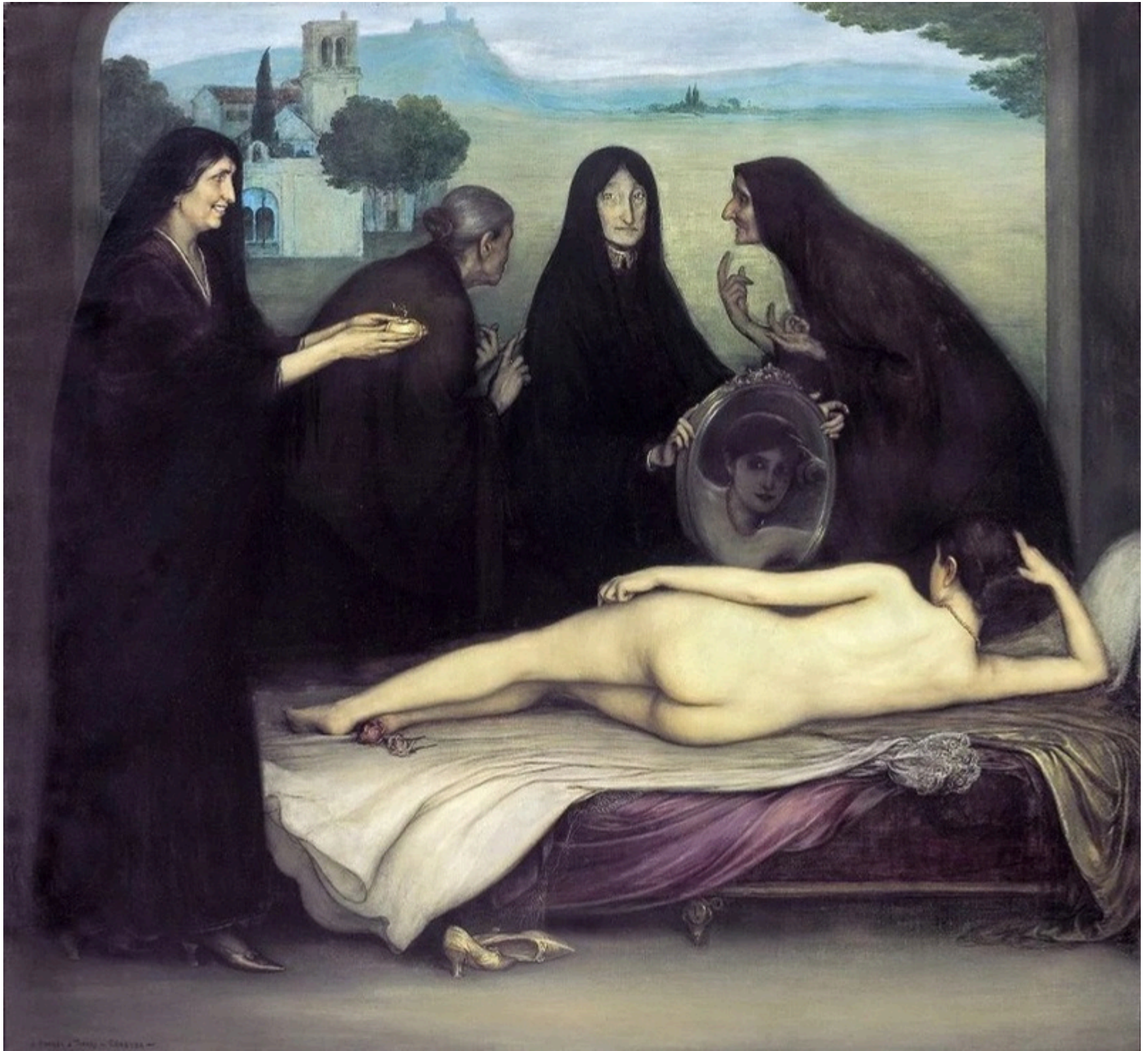
El pecado, 1913. Museo Julio Romero de Torres, Córdoba.