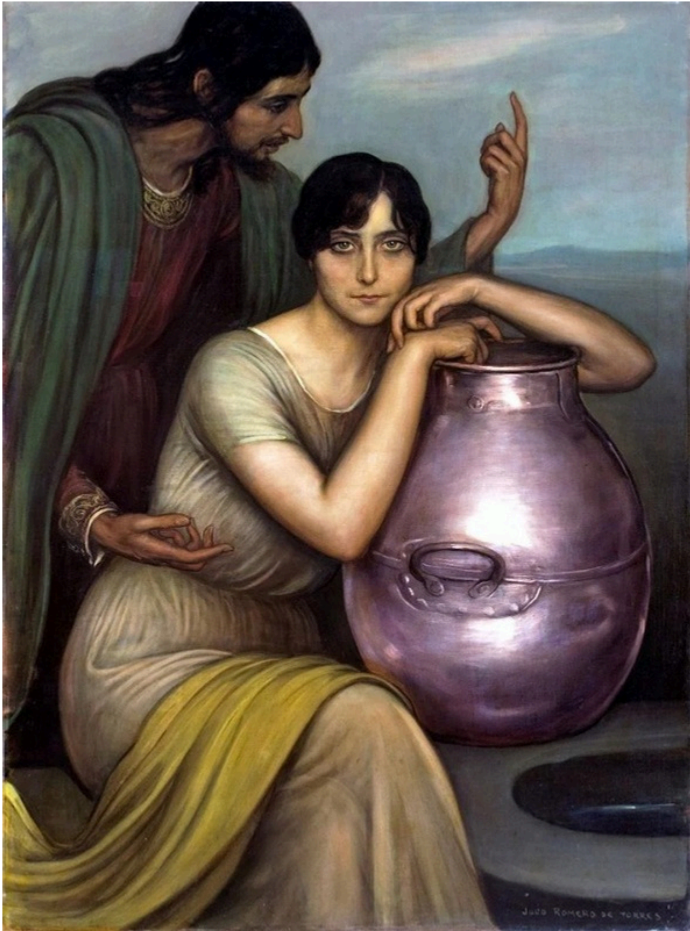
Samaritana , 1920. Museo Julio Romero de Torres, Córdoba