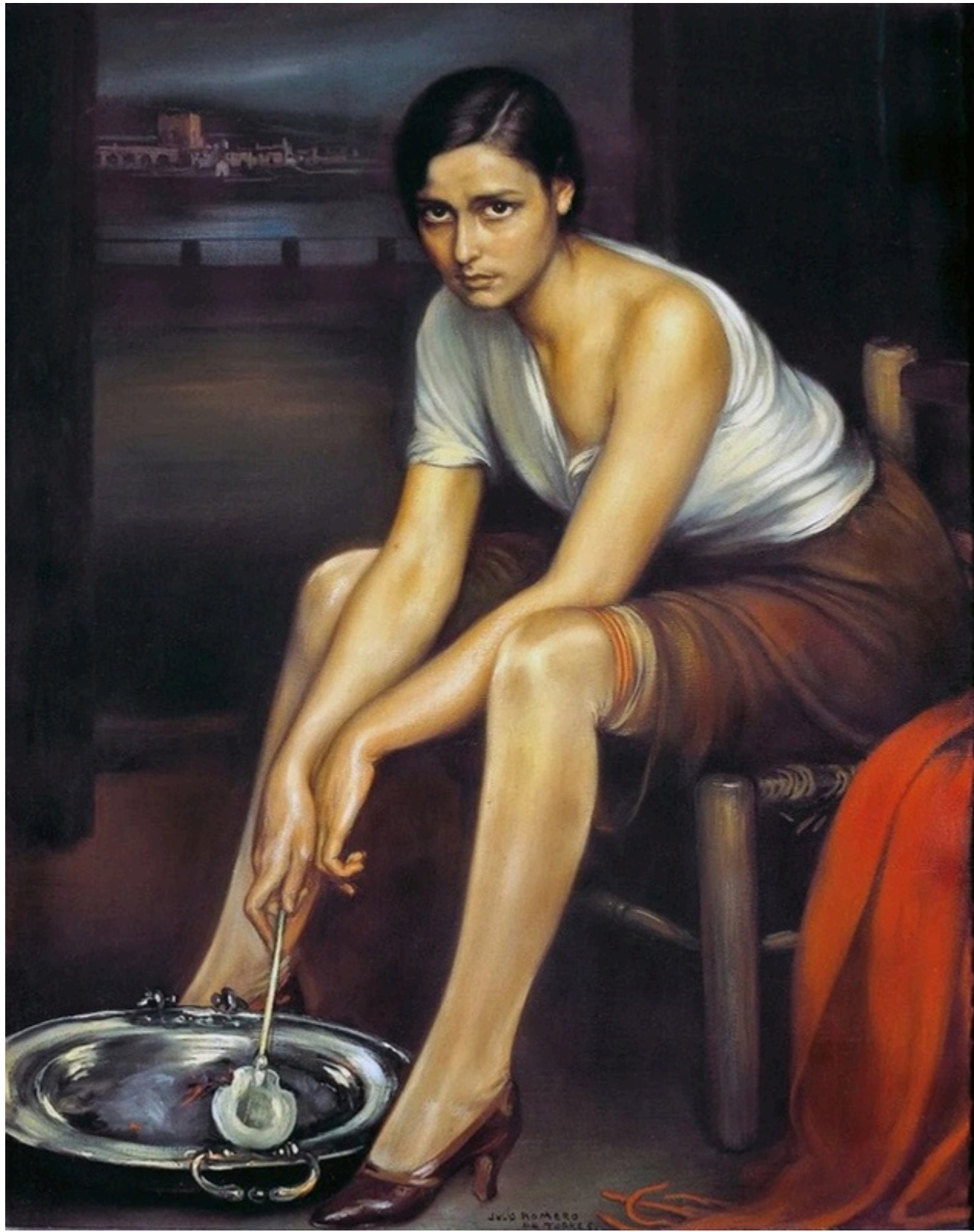
Chiquita piconera , 1930. Museo Julio Romero de Torres, Córdoba