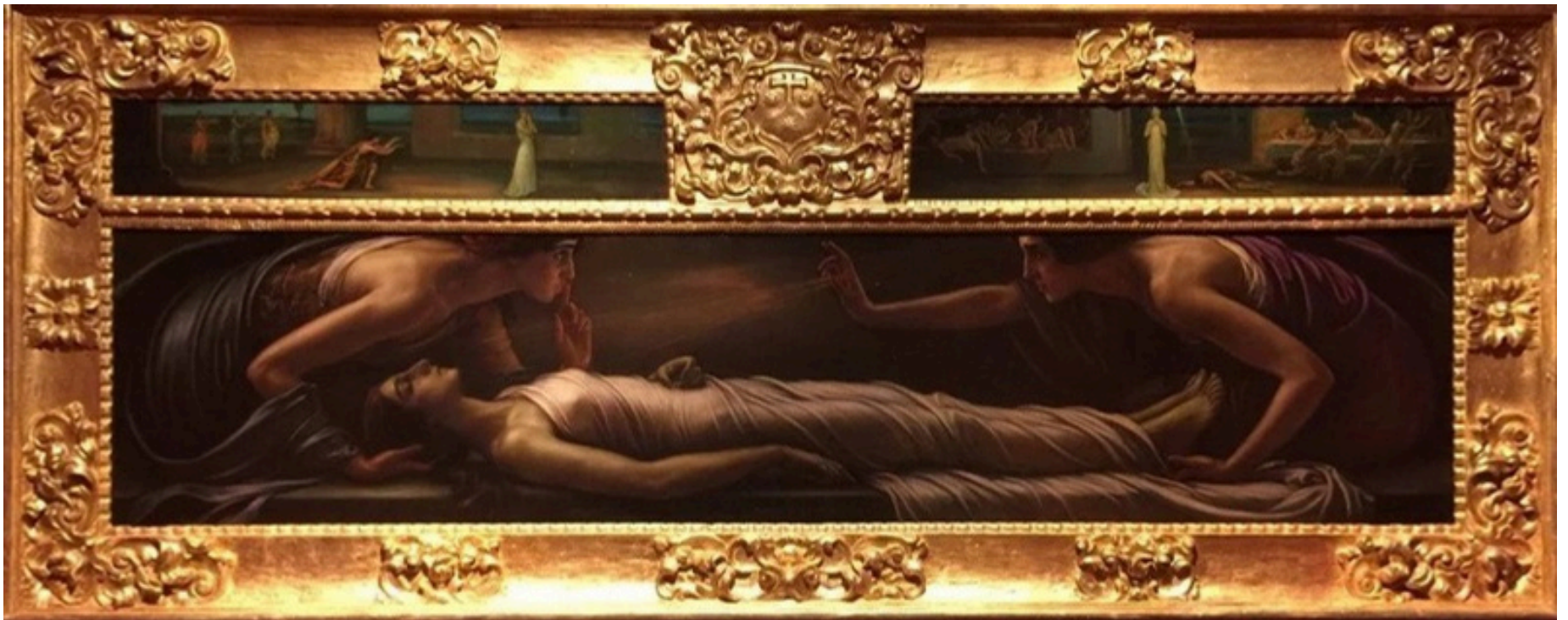
La muerte de Santa Inés, 1920. Museo Julio Romero de Torres, Córdoba