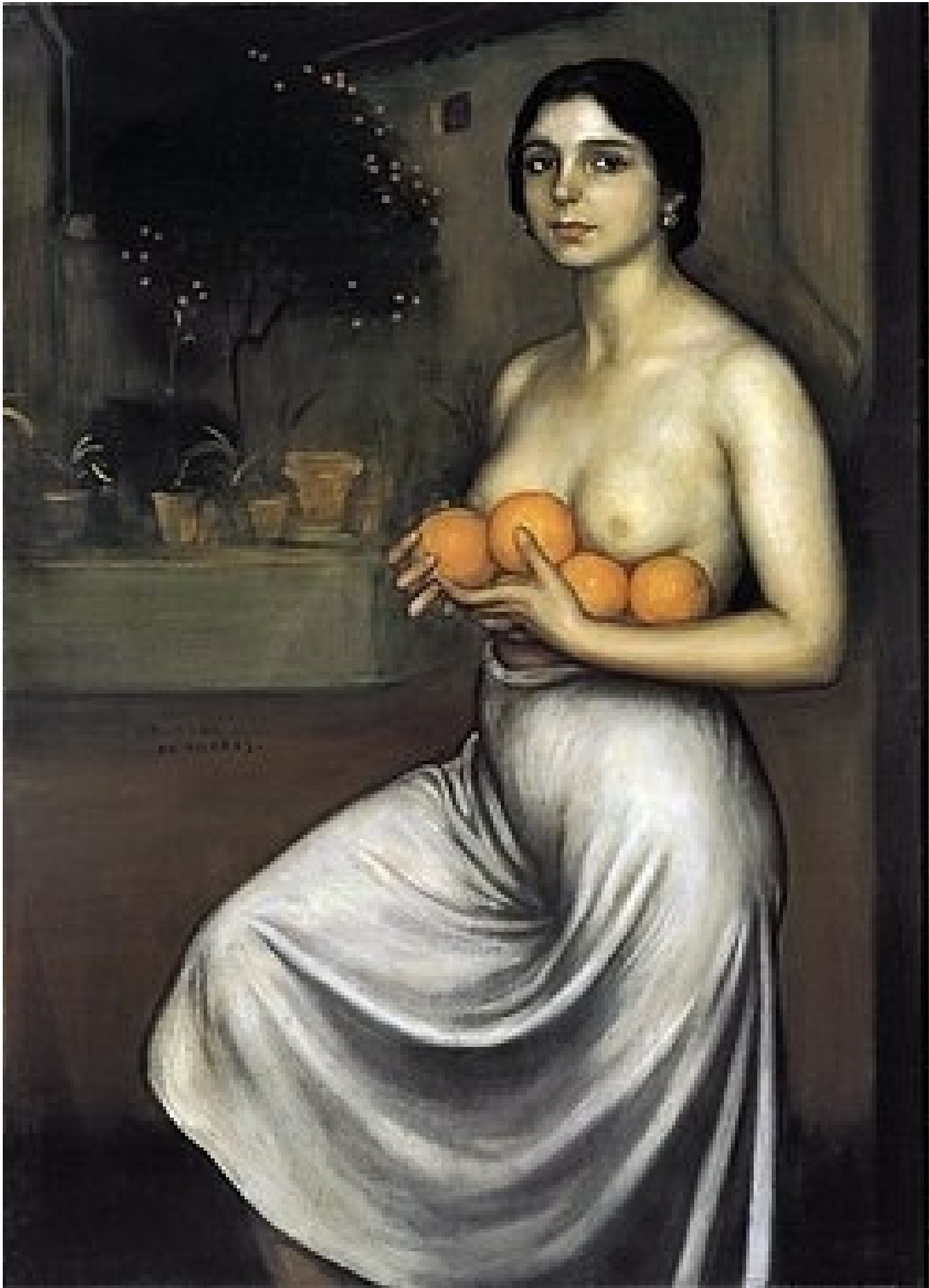
Naranjas y limones, 1928. Museo Julio Romero de Torres, Córdoba