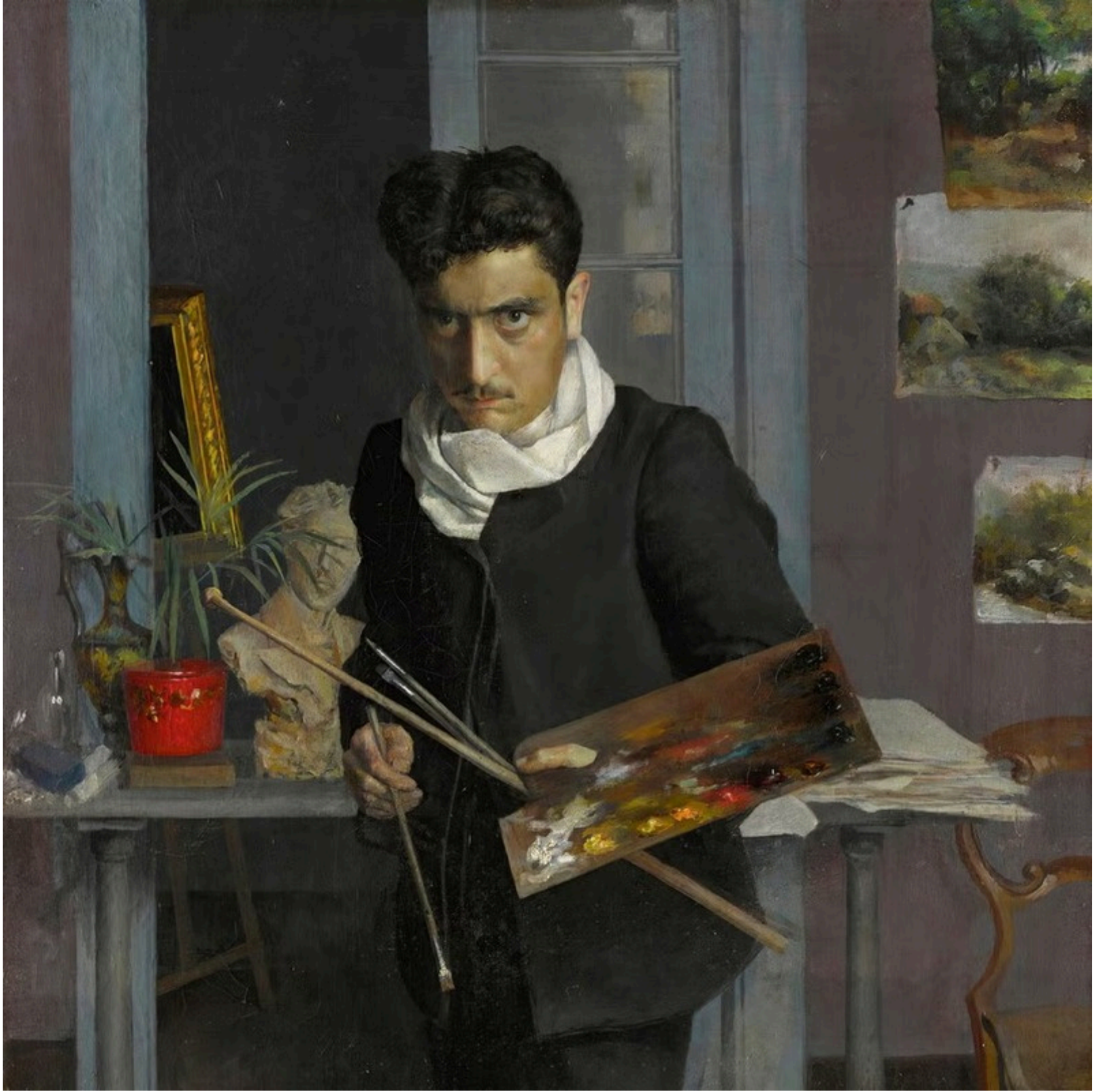
JULIO ROMERO TORRES, CÓRDOBA, 1874-1930