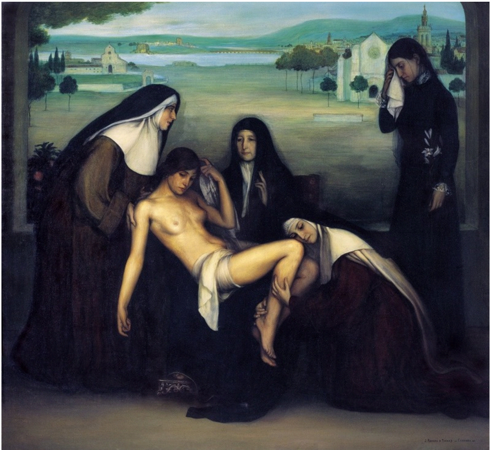
La gracia, 1913. Museo Julio Romero de Torres, Córdoba