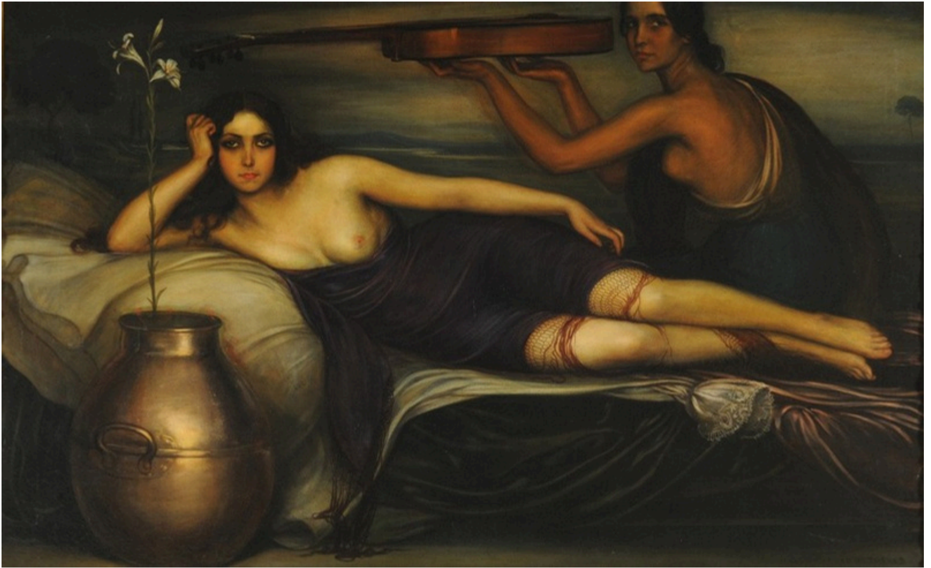
Musidora , 1922. Museo Nacional de Bellas Artes, Buenos Aires (Argentina)